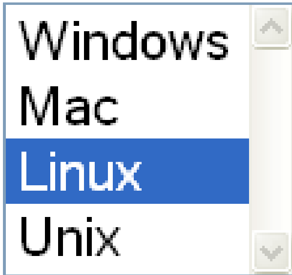
Obr. č.6 Formulářová pole zobrazená v prohlížeči