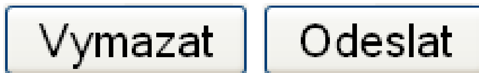
Obr. č.7 Formulářová pole a jejich zobrazení v prohlížeči

<p> <input type="reset" value="Vymazat" /> <input type="submit" value="Odeslat" /> </p>