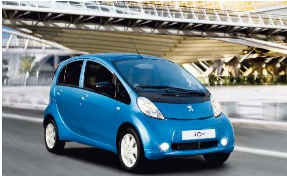
Obr. 4. Peugeot iOn – plně elektrické vozidlo