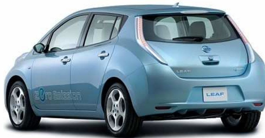
Obr. 5. – Nissan Leaf