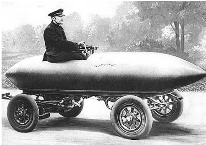
Obr. 1. - elektromobil Camilla Jenatzyho překonal v roce 1899 rychlost 100km/h