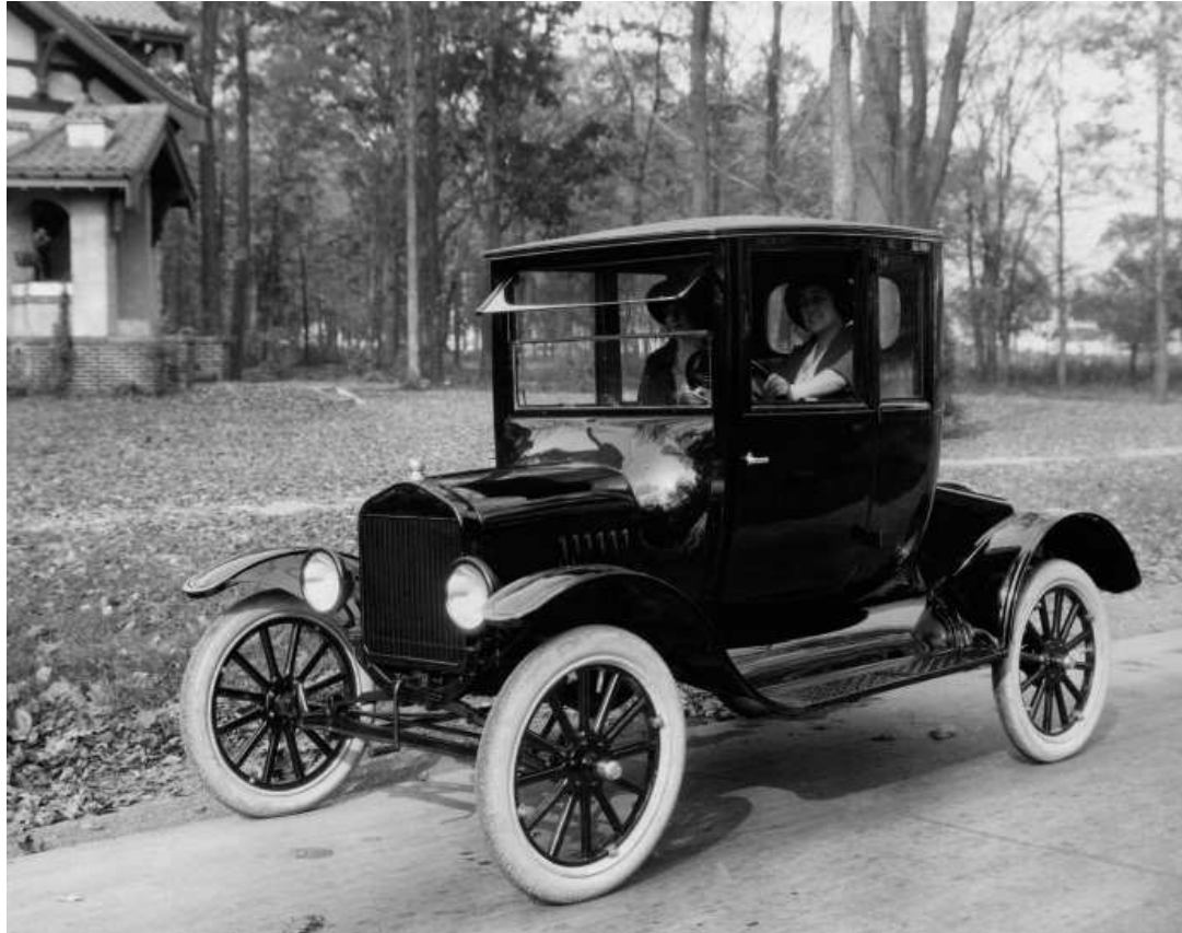
Obr. 2. – Ford model T