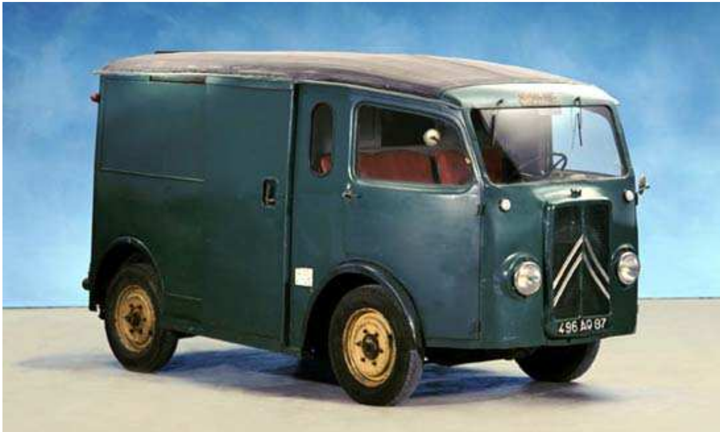
Obr. 3. – Citroen TUB elektrická verze